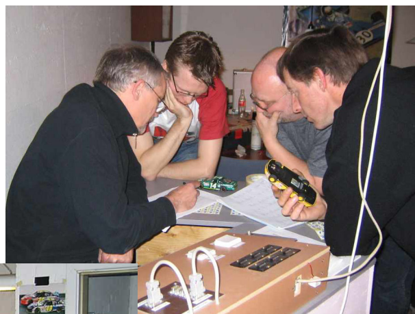
Bilerne gennemgår naturligvis en teknisk kontrol!

Banen er oven i købet indrettet sådan, at sporene snævrer ind i svingene. De tre inderste spor ligger tæt i den ene ende af banen og de tre yderste ligger tæt i den anden ende. Overhalinger skal med andre ord times, så de kan udføres der, hvor der er plads. Alt sammen påvirker koncentrationen – og så falder hastigheden. Det er utroligt svært at holde dampen oppe et helt heat.