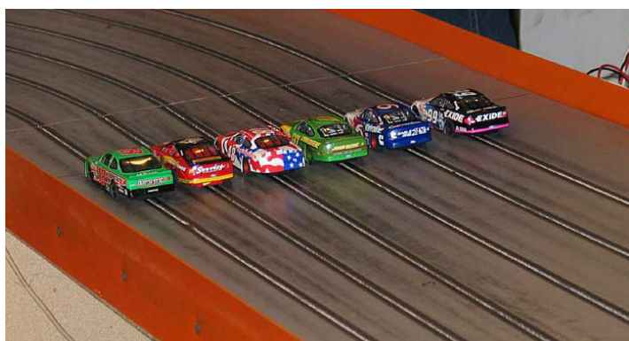
Startfeltet er klart til den rullende start!

Odense Mini Racing åbner dørene til to NASCAR-løb om året. Hidtil har der ikke været den helt store søgning af kørere udefra, men de, som har været der én gang, vender tilbage! Mottoet for løbene er, at det skal være sjovere at deltage end at vinde. Om det så er tilfældet, skal undertegnede ikke kunne udtale sig om – jeg kan kun sige, at det i hvert fald er sjovt at køre NASCAR set fra bunden af feltet.