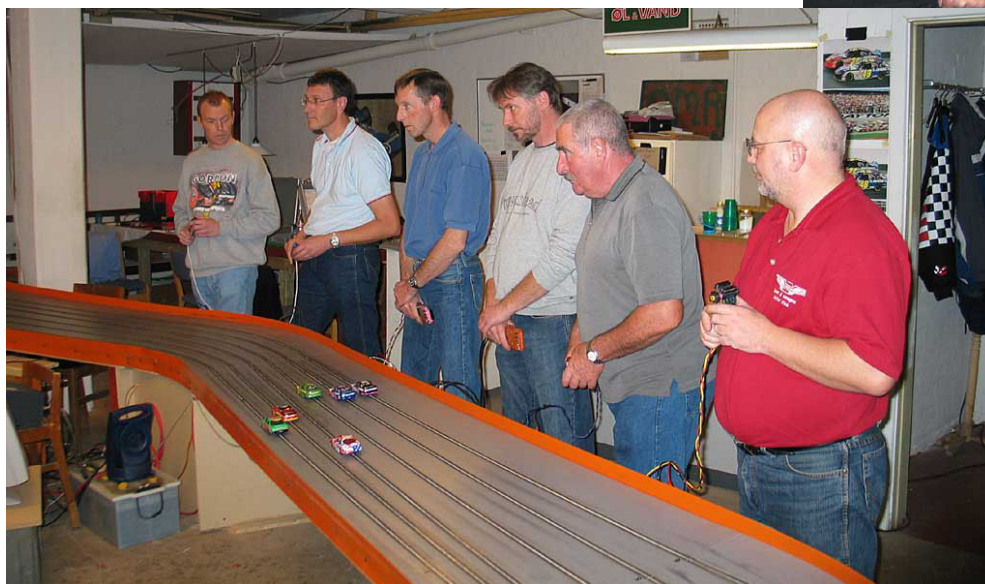
Der køres koncentreret og tæt!

En særlig feature ved banen er, at der køres med gult flag. Hvert løb overvåges af en løbsleder og hvis der sker et større crash dømmes han gul flagzone. Det betyder at spændingen går ned på ca. 7-8 volt og de „overlevende“ biler kan så cirkulere langsomt mens påsættene rydder op. En fed detalje, som er med til at skabe en rigtig løbsstemning. Der er dog enkelte elektroniske håndspeedere, som har lidt svært ved at håndtere den lave spænding, så det er en god ide lige at have en almindelig ohmsk speeder som backup. Ohm-værdien er ikke kritisk. 25 passer fint, men der kan også sagtens køres med helt ned til 2 ohm – der er jo ikke rigtig noget, som hedder mellemgas på banen.