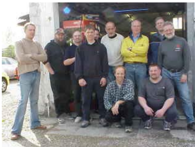
Alle delatgerne samlet.