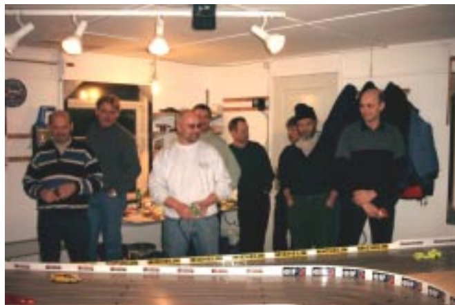
Arkivfoto fra Holzenheim!