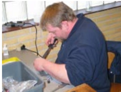
Team Maxi HMK skruer!