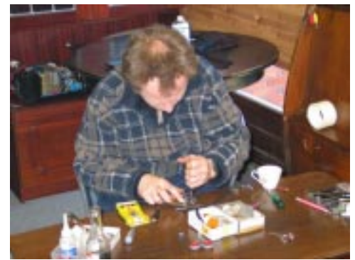
Team Mini HMK skruer!