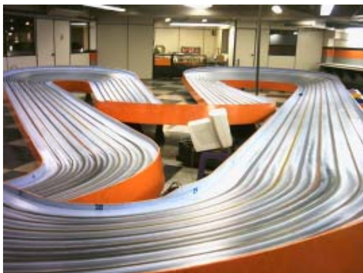
VM-banen hos Top Slot Raceways i Rio de Janeiro, Brasilien