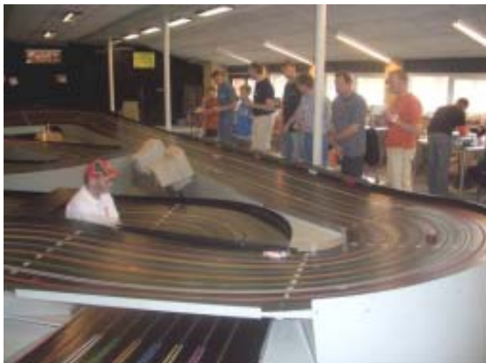
Et blik ud over banen og den svedige aktivitet omkring den!

Mange af deltagerne havde aldrig før set eller kørt på en bane af denne type, som har meget store sving og en stejlkurve, som gør at der kan opnås meget høje hastigheder. Det viste sig