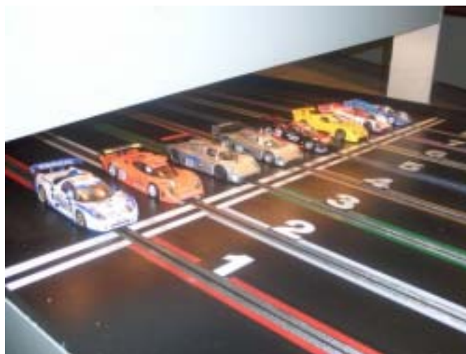
Finale-bilerne holder klar til start!

7. stint,.....igen Peter med 8,368 som bedste omgangstid, han nåede samme antal omgange som Jesper.