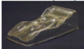
Porsche 917 ( 022 )