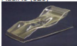
BMW LMRP ( 027 )