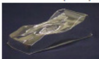
Reynard ( 037 )