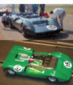
1968 Matich CanAm (Patto)