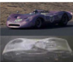
1967 Ford Honker (Patto)