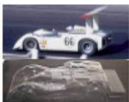
1968 Chaparral 2G (Patto)