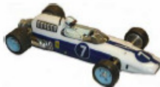
1964 Ferrari 512 Howmet