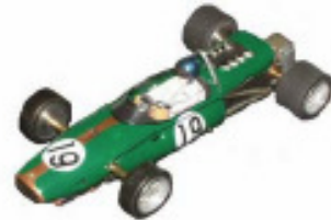
1966 Brabham BT20 Repco Lancer