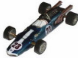
1967 Eagle Weslake F1 Lancer eller Dynamic