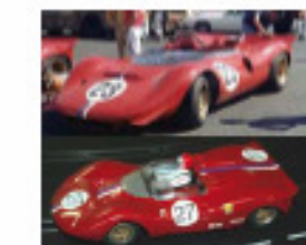
1968 Ferrari P4 CanAm (Patto)