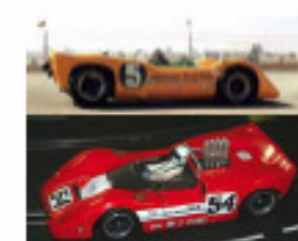
1967 McLaren M6A (Patto)