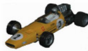
1967-69 McLaren M7 Beta + Howmet