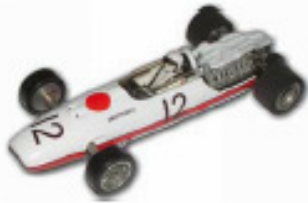
1966 Honda RA273 F1 Russkit eller Lancer

Karrosserier ud over disse er ikke tilladte.