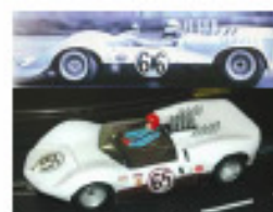
1964 Chaparral 2C (Patto)