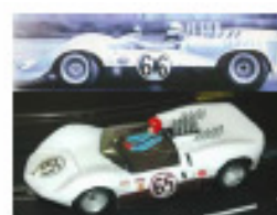
1964 Chaparral 2C (Patto)