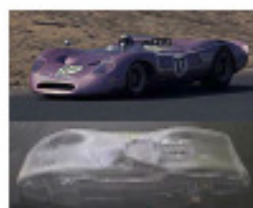
1967 Ford Honker (Patto)