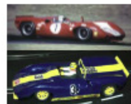
1966 Lola T70 Spyder (Patto, WhitePoint)