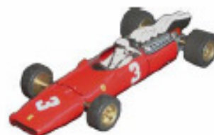
1967 Ferrari 312 F1 Lancer eller Howmet