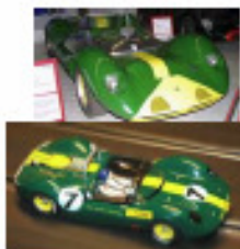
1965 Lotus 40 (Patto)