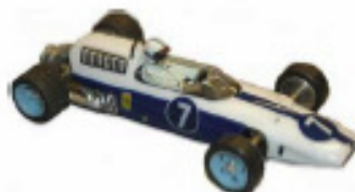
1964 Ferrari 512 Howmet