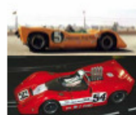
1967 McLaren M6A (Patto)