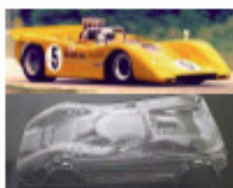
1968 McLaren M8A (Patto)