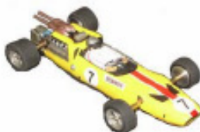
1966 McLaren M2B F1 Lancer (?)