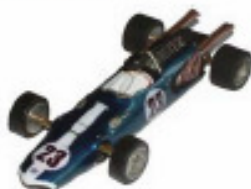
1967 Eagle Weslake F1 Lancer eller Dynamic