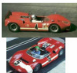
1966 McLaren M1B (Patto)