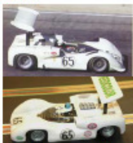
1967 Chaparral 2E (Patto)