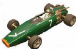
1966 BRM P83 H16 F1 Lancer