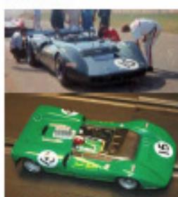
1968 Matich CanAm (Patto)