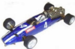
1966 Cooper T81 Maserati Lancer