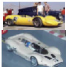
1967 King Cobra (Patto)