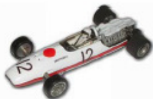
1966 Honda RA273 F1 Russkit eller Lancer

Karrosserier ud over disse er ikke tilladte.