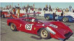
1969 Ferrari 612 (Patto)