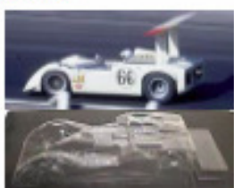
1968 Chaparral 2G (Patto)