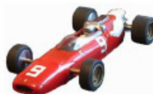
1966 Ferrari 312 F1 Pactra eller Dubro