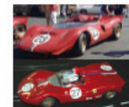
1968 Ferrari P4 CanAm (Patto)