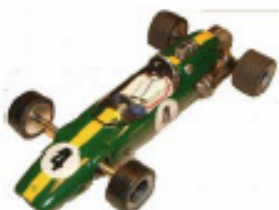
1965 Lotus 33 Howmet