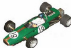
1966 Brabham BT20 Repco Lancer