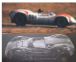
1965 Genie FD (Patto)