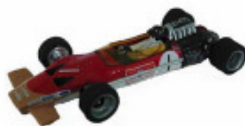
1967-69 Lotus 49 + 49B Howmet