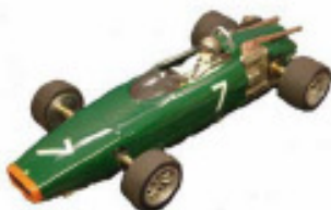
1967 BRM P83 H16 F1 Lancer