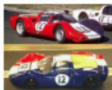
1965 Porsche 906 (Patto)