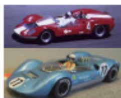
1964 McLaren Elva (Patto)